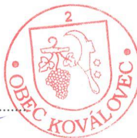
..... Obec Koválovec