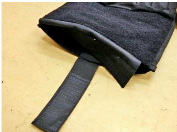
Obrázok č. 6

Vesta obsahuje veľké vrecko v prednom aj zadnom diely, ktoré vyplňa vnútro celého dielu. Rozmer vnútorného vrecka: šírka: 275 \pm 5 mm, výška: 335 \pm 5 mm, tvar vrecka: obdĺžnik. Otvárateľné je zdola. Uzatvárateľné suchým zipsom po celej dĺžke otvoru. Šírka suchého zipsu: 38 \pm 5 mm. Na vnútornej stene vrecka sa v strede nachádza pevný popruh o šírke 50 mm opatrený suchým zipsom (háčik), ktorý sa uchyťava k protiľahlej vnútornej stene, ktorá je opatrená suchým zipsom (vlas). Slúži na fixáciu uložených predmetov proti náhodnému vypadnutiu a pohybu (Obrázky č. 6 a 7).