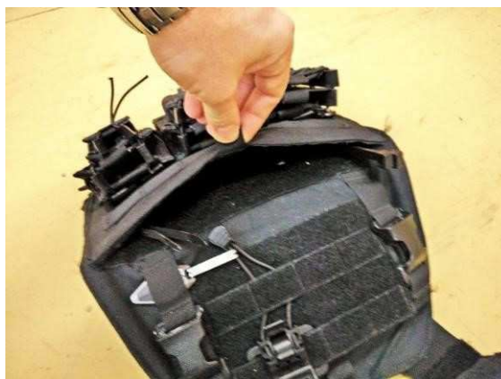
Obrázok č. 9

Na zadnom diely vesty sa nachádza tzv. Oko záchrany . Jedná sa o integrovaný popruhový systém, ktorý umožní používateľovi odtiahnutie z krízovej situácie. Skladá sa z popruhu a oka.