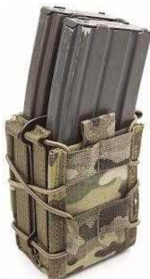
Obrázok č. 19