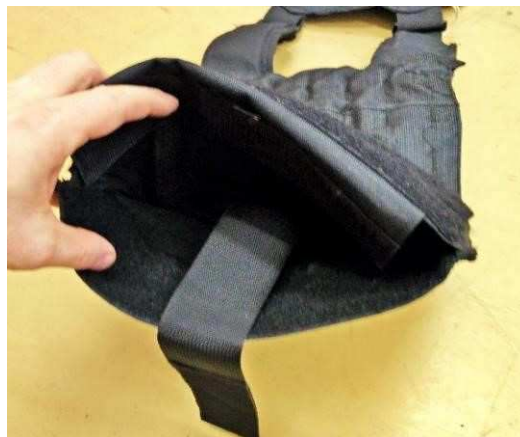
Obrázok č. 7

Na prednom diely vesty sa nachádzajú dve skryté vrecká.