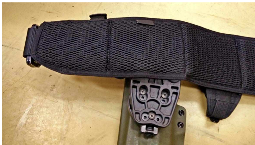
Obrázok č. 13

Dĺžka taktického návleku: 900 \pm 10 mm.