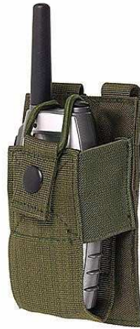
Obrázok č. 17