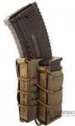
Obrázok č. 18