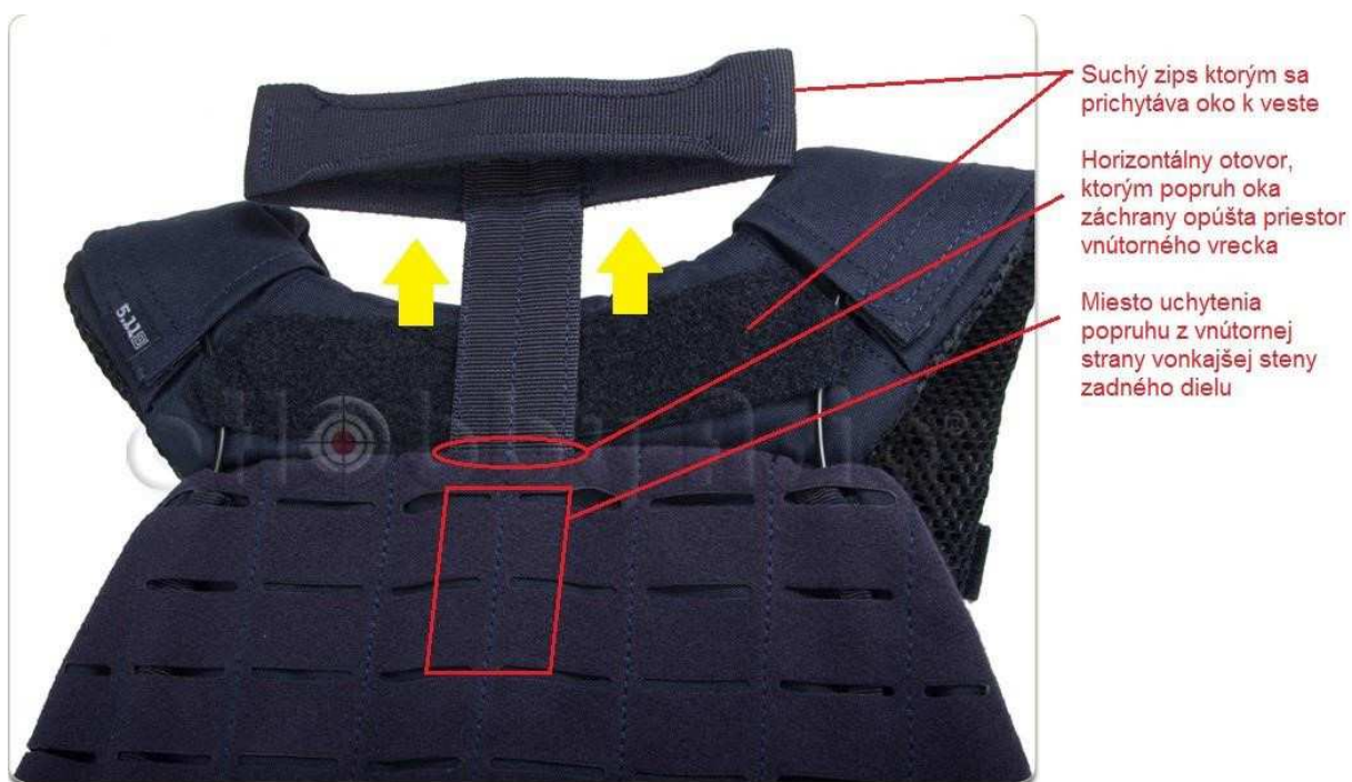
Obrázok č. 11