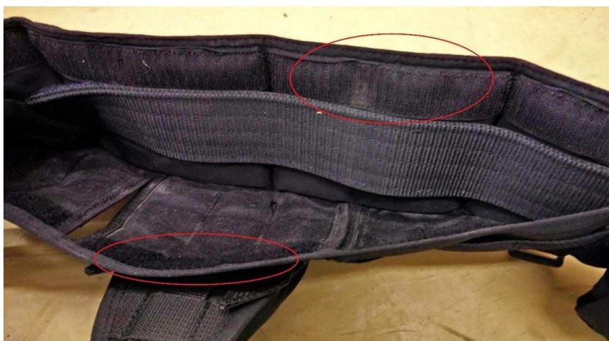
Obrázok č. 14

Spodná strana návleku je otvorená, z vnútornej strany vybavená suchým zipsom o šírke 30 \text{ mm} \pm 2 mm tak, aby sa dal návlek uzavrieť (Obrázok č. 14) z dôvodu nutnosti zachovania možnosti upevniť výstroj aj priamo na opasok. Napríklad puzdro na pištoľ atď.