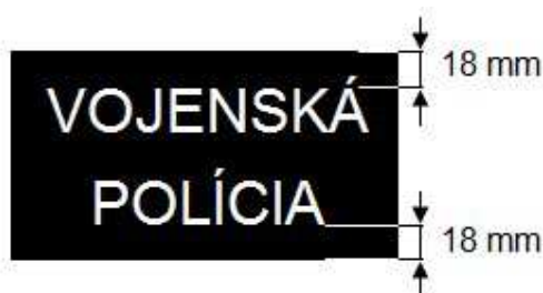
Obrázok č. 4

Centrovanie každého slova v horizontálnom smere je na stred nášivky. Vzďialenosť slova „Vojenská“ (diakritika sa tu neberie do úvahy) je 18 mm od horného okraja nášivky. Vzďialenosť slova „POLÍCIA“ je 18 mm od dolného okraja nášivky (Obrázok č. 4).