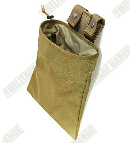
Obrázok č. 21