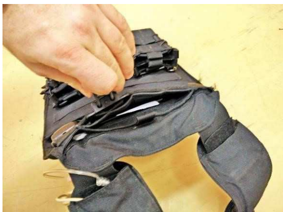
Obrázok č. 8