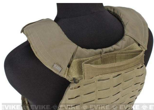
Obrázok č. 10

Nad otvorom, ktorým sa z vesty vysúva popruh oka záchrany je našitý suchý zips (vlas) o rozmeroch 150 \text{ mm} \times 35 \pm 2 \text{ mm} , na ktorý sa prichytáva samotné oko záchrany.