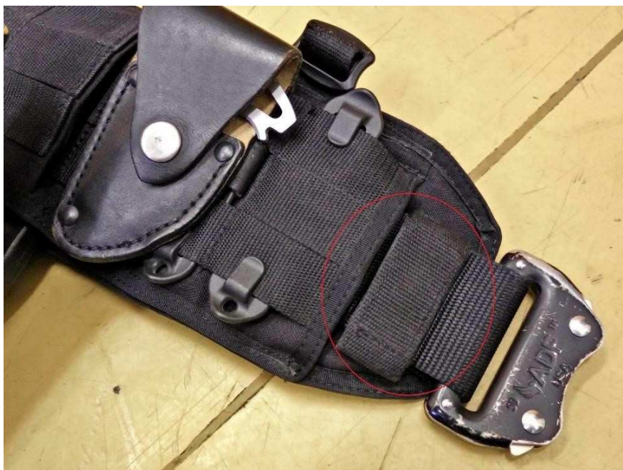
Obrázok č. 15