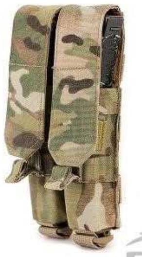
Obrázok č. 20