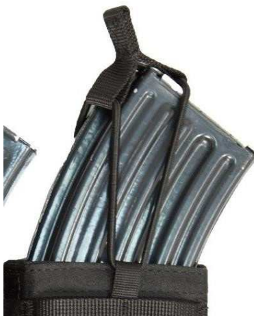
Obrázok č. 16

Zabezpečenie každého zásobníku a aj vysielačky cez gumku (Obrázok č. 16).