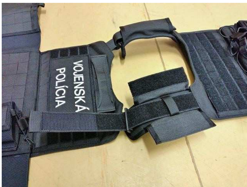
Obrázok 1 – Ramenné popruhy

Vnútná strana predného aj zadného dielu je polstrovaná a opatrená materiálom s 3D štruktúrou. Na spodnej strane predného aj zadného dielu sa nachádza chlopňa, pod ktorú sa upevňujú bočné diely vesty. Vnútná stena chlopne spolu s časťou predného alebo zadného dielu, ktorá je ňou zakrytá, je celá pokrytá suchým zipsom (vlas). Ukážka chlopne je na obrázkoch č. 2 a 3.