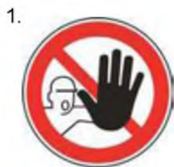
Nepovolaným vstup zakázaný (spolu so značkou č. 2, 3 alebo 4 a príslušnou dodatkovou tabuľou)