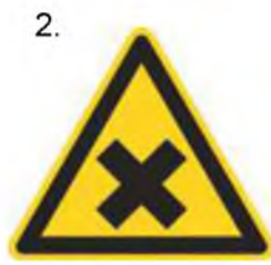
Nebezpečenstvo škodlivej alebo dráždivej látky