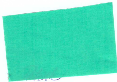
Potisk Vojtech odberateľ