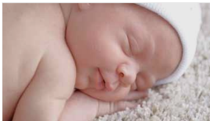
TAKÉ PRO VAŠE MALÉ PACIENTY (DEHP, latex, PVC free)