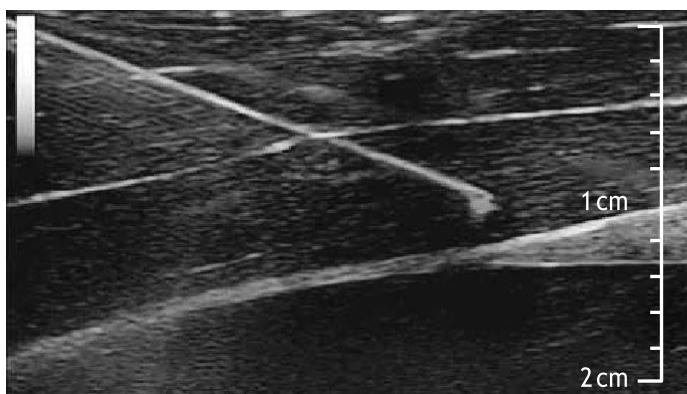
VIDITELNÝ PŘI ZAVÁDĚNÍ PROVÁDĚNÉM POD ULTRAZVUKEM (kontrastní pruhy)

Katétry Introcan Safety® (bez portu) pro hluboký přístup jsou navrženy tak, aby v obtížných žilních podmínkách poskytovaly větší flexibilitu pro výběr vhodných žil. Prodloužená délka pomáhá zajistit, aby v žíle byla dostatečně dlouhá část katétru, což brání jeho vytažení. Koncept transparentní krevní komůrky a bezpečnostního prvku na hrotě jehly (aktivující se automaticky po vytáhnutí jehly z katétru) zůstal zachován.