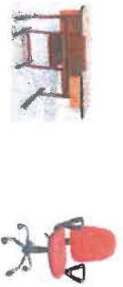
S80 Dany, katedra stoly na obrázku, vyškova nastavitelne, bez kategrórie, učňa doska bude nastaviteľ