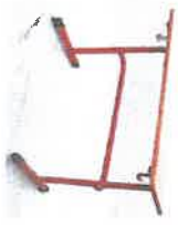
viď položka 11, špeciálna je rovnaká