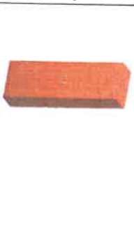
Laboratorna stola vyškova nastavitelne na prahu, podľa zadania, obrázok je ilustračný