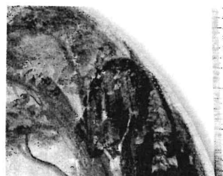
Averz: Sv. Izidor – celok a detaily