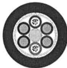
6 Elements Cable