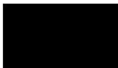
Ing. Táňa Pastorková splnomocnenkyňa na základe splnomocnenia z 27. apríla 2011