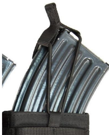
Obrázok č. 16

Sumka na vysielacu TPH 700: jeden kus na vestu.