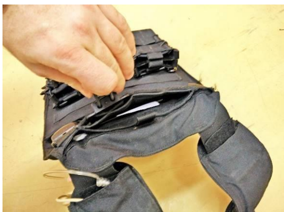
Obrázok č. 8

Šírka pásu suchého zipsu dolného vrecka: 38 \pm 5 mm.