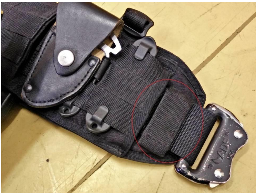
Obrázok č. 15

Na lepšie upevnenie opasku v návleku sú použité 4 vodiace pútka o šírke 20 mm \pm 2 mm. Krajné pútka (Obrázok č. 15) sa nachádzajú čo najbližšie ku kraju návleku a sú zapínateľné suchým zipsom. Ostatné pútka sú rovnomerne rozmiestené v návleku tak, aby boli skryté pod tretím panelom od kraja návleku.