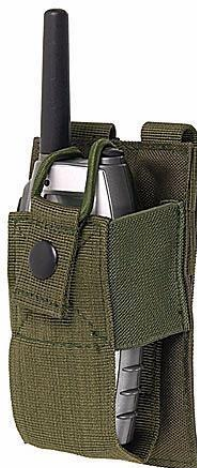
Obrázok č. 17

Na sumke sa nachádza gumená väzba, ktorou je možné fixovať vysielacu v sumke spôsobom, aký je vyobrazený na Obrázku č. 19.