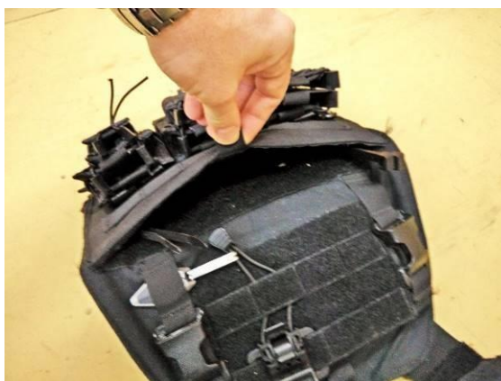
Obrázok č. 9

Na zadnom diely vesty sa nachádza tzv. Oko záchrany . Jedná sa o integrovaný popruhový systém, ktorý umožní používateľovi odtiahnutie z krízovej situácie. Skladá sa z popruhu a oka.