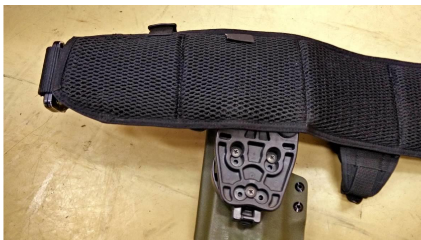
Obrázok č. 13

Návlek je vyrobený z rovnakej tkaniny ako vesta. Vnútrná strana návleku je polstrovaná a opatrená materiálom s 3D štruktúrou (Obrázok č. 13).