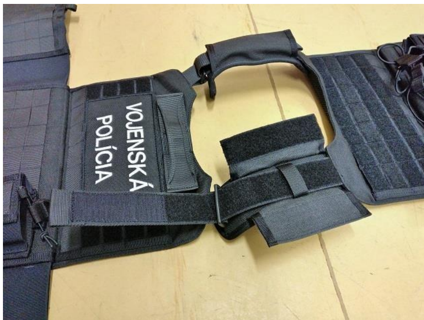
Obrázok 1 – Ramenné popruhy

Vnútorňa strana predného aj zadného dielu je polstrovaná a opatrená materiálom s 3D štruktúrou. Na spodnej strane predného aj zadného dielu sa nachádza chlopňa, pod ktorú sa upevňujú bočné diely vesty. Vnútorňa stena chlopne spolu s časťou predného alebo zadného dielu, ktorá je ňou zakrytá, je celá pokrytá suchým zipsom (vlas). Ukážka chlopne je na obrázkoch č. 2 a 3.