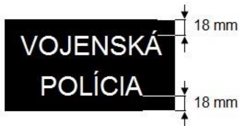
Obrázok č. 4

Centrovanie každého slova v horizontálnom smere je na stred nášivky. Vzďialenosť slova „Vojenská“ (diakritika sa tu neberie do úvahy) je 18 mm od horného okraja nášivky. Vzďialenosť slova „POLÍCIA“ je 18 mm od dolného okraja nášivky (Obrázok č. 4).