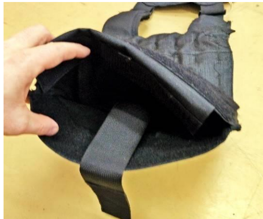
Obrázok č. 7

Na prednom diely vesty sa nachádzajú dve skryté vrecká.