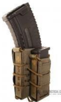
Obrázok č. 18