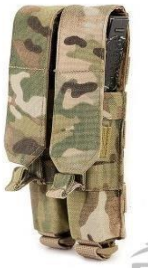
Obrázok č. 20