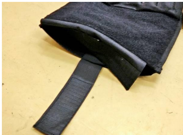
Obrázok č. 6

Vesta obsahuje veľké vrecko v prednom aj zadnom diely, ktoré vyplňa vnútro celého dielu. Rozmer vnútorného vrecka: šírka: 275 \pm 5 mm, výška: 335 \pm 5 mm, tvar vrecka: obdĺžnik. Otvárateľné je zdola. Uzatvárateľné suchým zipsom po celej dĺžke otvoru. Šírka suchého zipsu: 38 \pm 5 mm. Na vnútornej stene vrecka sa v strede nachádza pevný popruh o šírke 50 mm opatrený suchým zipsom (háčik), ktorý sa uchyťava k protiľahlej vnútornej stene, ktorá je opatrená suchým zipsom (vlas). Slúži na fixáciu uložených predmetov proti náhodnému vypadnutiu a pohybu (Obrázky č. 6 a 7).