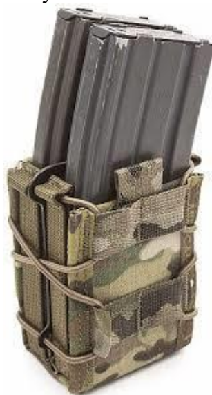
Obrázok č. 19