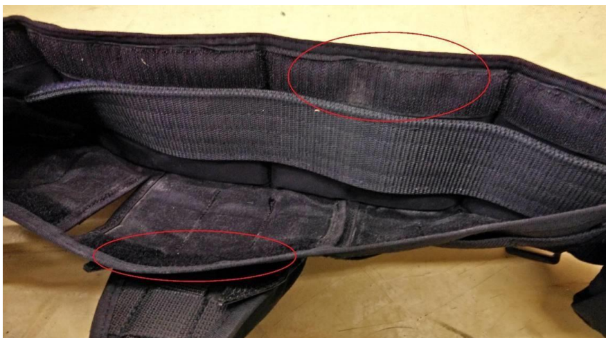
Obrázok č. 14

Spodná strana návleku je otvorená, z vnútornej strany vybavená suchým zipsom o šírke 30 mm \pm 2 mm tak, aby sa dal návlek uzavrieť (Obrázok č. 14) z dôvodu nutnosti zachovania možnosti upevniť výstroj aj priamo na opasok. Napríklad puzdro na pištoľ atď.