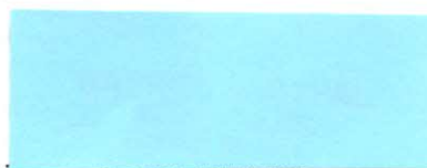
za organizáciu podpis a pečiatka

Zo zmluvnými podmienkami dohody je uzročený zákonný zástupca žiaka resp. plnoletý žiak a svojím podpisom vyjadruje súhlas s jednotlivými bodmi tejto dohody o zabezpečení a vykonaní súvislej odbornej praxe.