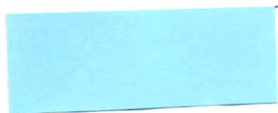
podpis a pečiatka

Zo zmluvnými podmienkami dohody je uzročený zákonný zástupca žiaka resp. plnoletý žiak a svojím podpisom vyjadruje súhlas s jednotlivými bodmi tejto dohody o zabezpečení a vykonaní súvislej odbornej praxe.