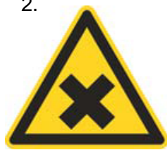
Nebezpečenstvo škodlivej alebo dráždivej látky