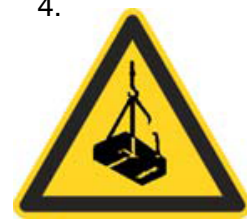
Nebezpečenstvo pádu alebo pohybu zaveseného bremena