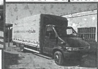
Preprava odpadov ADR