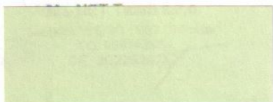
pečiatka a podpis zodpovednej osoby za Ma-NET Team s.r.o.