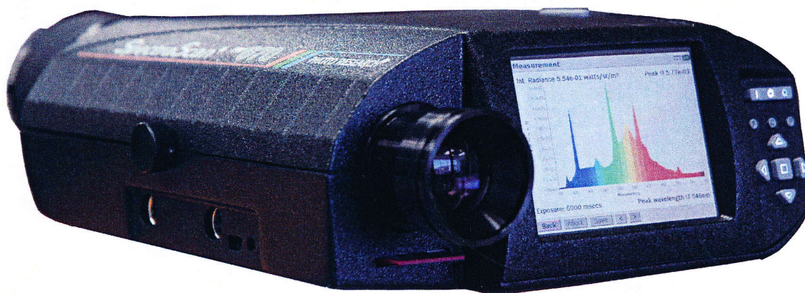
Obr. a) Fotografia dodávaného prenosného spektrofotometra PR-670 - SpectraScan

Požadované minimálne parametre a funkcionality prenosného spektrofotometra objednávateľom podľa označenia v súťažných podkladoch a technické parametre dodávaného prenosného spektrofotometra PR-670 - SpectraScan s príslušnými súčasťami s vyhodnotením ich splnenia sú v nasledovnej tabuľke.