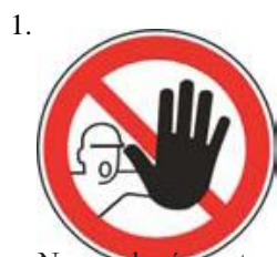
Nepovolaným vstup zakázaný (spolu so značkou č.2, 3 alebo 4 a príslušnou dodatkovou tabuľou)