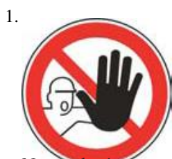
Nepovolaným vstup zakázaný (spolu so značkou č.2, 3 alebo 4 a príslušnou dodatkovou tabuľou)