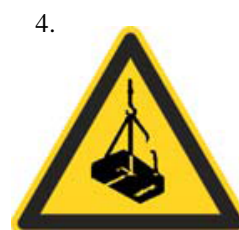
Nebezpečenstvo pádu alebo pohybu zaveseného bremena