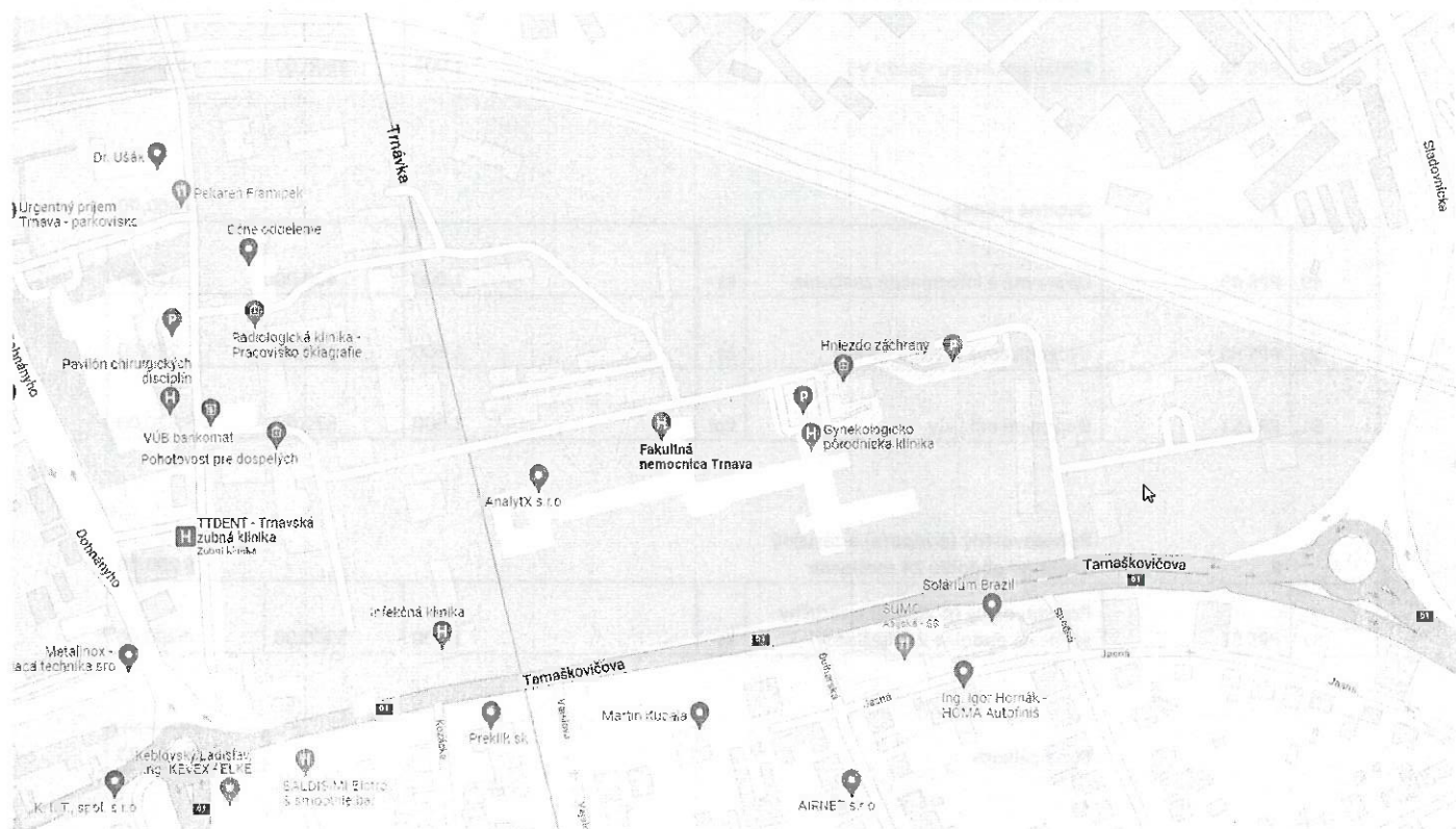
1. Celková mapa areálu