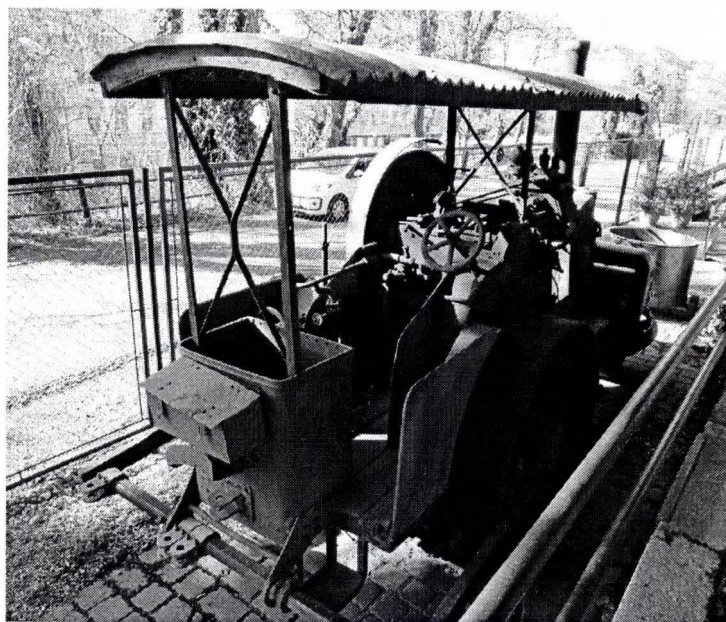
Župný parný valec č. 5 výrobca: Škoda Hradec Králové, rok výroby: 1927, výr. č.: 2420