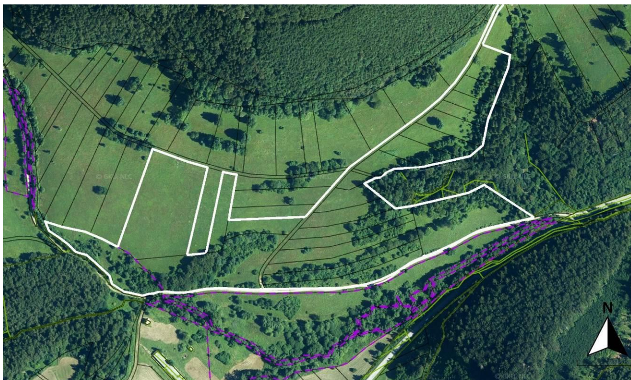
k. ú. Čičmany, Lok. 1 (Hanušová)