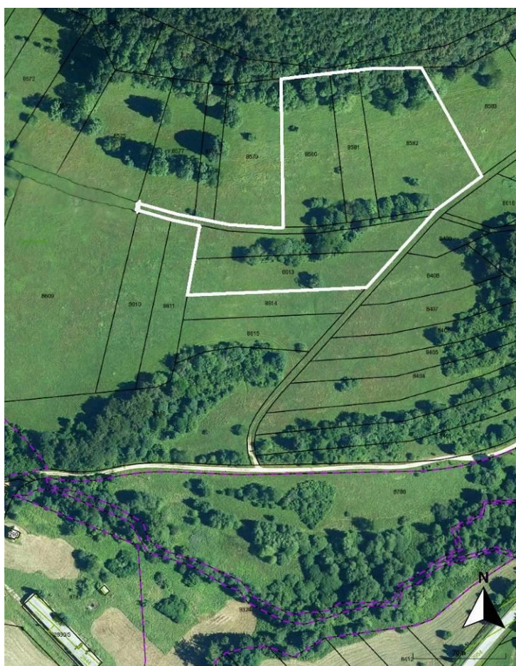
k. ú. Čičmany, Lok. 2 (Košariská)