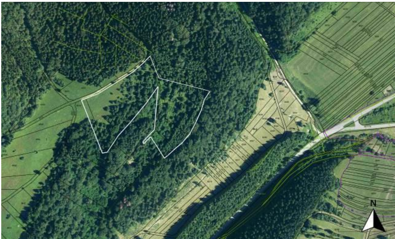
k. ú. Čičmany, Lok. 3 (Harvanice)