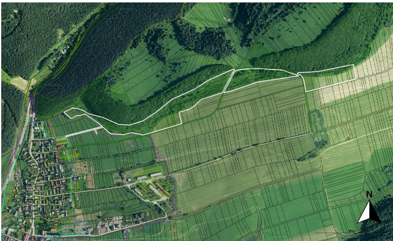
k. ú. Čičmany, Lok. 4 (Podbrežie)