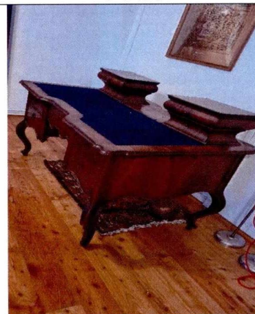
F 10655 (bočný pohľad)