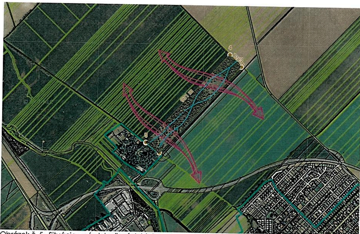
Obrázok č. 5 - Situácia – návrh krajinných biotopov - skupín, rozvolnených skupín a solitér stromov na lúčnych plochách na parcele registra E č. 1485 o výmere 119 136 m 2 (Trnava - Štrky)