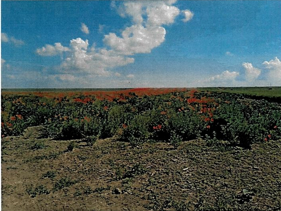
Obrázok č.3 - Foto z 11.06.2021