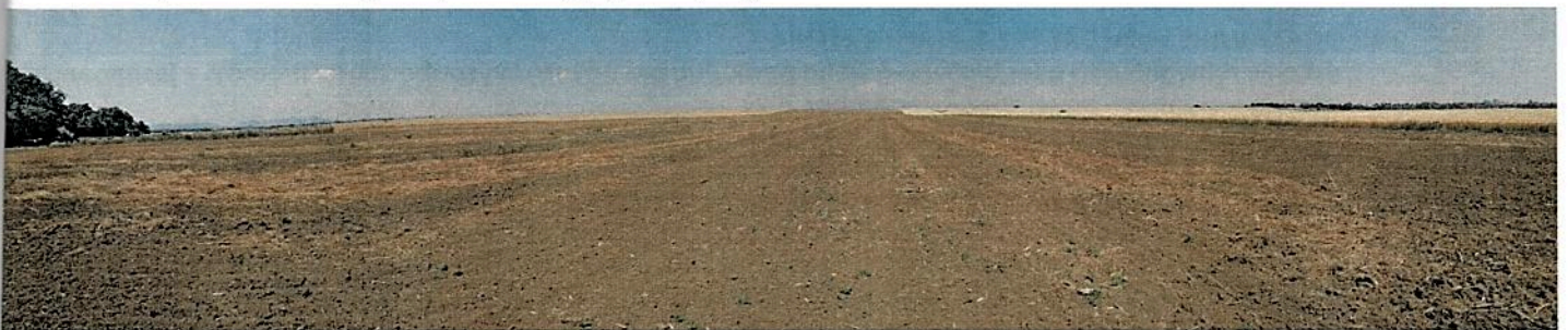
Obrázok č.4 - Foto z 07.07.2021