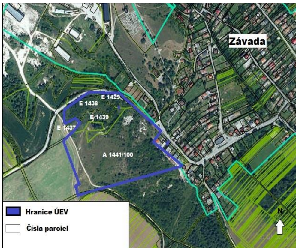
Príloha č. 1 – ÚEV Dolné lazy