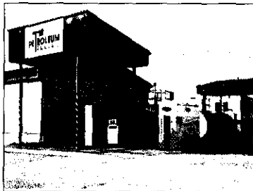
ČS TIR PETROLEUM, Nitrianska, Trnava