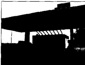
ČS TIR PETROLEUM, Koniarekova, Trnava