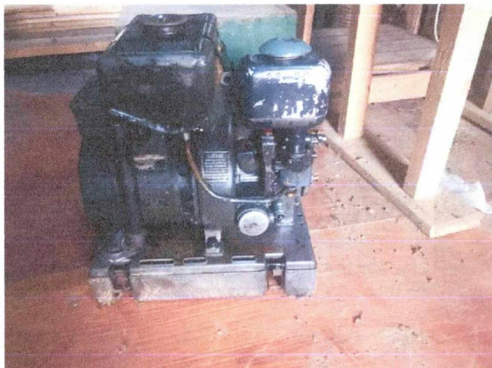
Elektrocentrála nemecká z druhej svet. vojny - 200 Eur