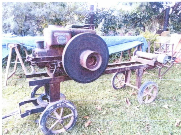
Diezel stroj jedno-valec DEUTZ prerobený ako pohon cirkulárky