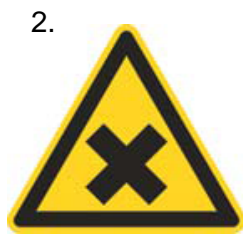
Nebezpečenstvo škodlivej alebo dráždivej látky