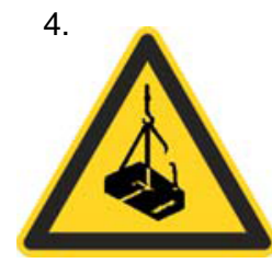
Nebezpečenstvo pádu alebo pohybu zaveseného bremena