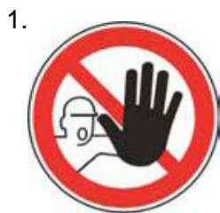
Nepovolaným vstup zakázaný (spolu so značkou č.2, 3 alebo 4 a príslušnou dodatkovou tabuľkou)