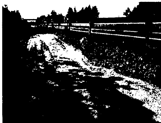
Obr.1a-b: Odkop okrajovej časti násypu cestného telesa D1 – pravá strana

Deformačná odolnosť podložia bola preverená statickými zaťažovacími skúškami, pričom na zemine typu G4 pri optimálnej nižšej vlhkosti je možné dosiahnuť po zhutnení hodnotu E_{def,2} \geq 30 MPa, čo je postačujúce pre zhotovenie koštrukčnej vrstvy zo štrkodrviny hrúbky 500 mm s deformačnou odolnosťou E_{def,2} \geq 90 MPa podľa požiadaviek projektu stavby. V lokálnych miestach s vyššou vlhkosťou alebo s vyšším obsahom jemnozrnej zložky bude deformačná odolnosť E_{def,2} \leq 20 MPa. V týchto miestach je potrebné urobiť lokálnu výmenu nevhodnej zeminou, ktorú je potrebné nahradiť vrstvou hrúbky 500 mm z kamenitej sypaniny fr. 0/125, pri extrémnej vlhkosti zeminou pôvodnej konštrukcie bude potrebné použiť kamenitú vrstvu fr. 60/300 a hrúbku sanančnej vrstvy 600 mm.