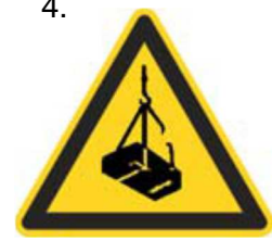
Nebezpečenstvo pádu alebo pohybu zaveseného bremena