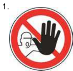
Nepovolaným vstup zakázaný (spolu so značkou č.2, 3 alebo 4 a príslušnou dodatkovou tabuľkou)