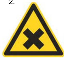
Nebezpečenstvo škodlivej alebo dráždivej látky