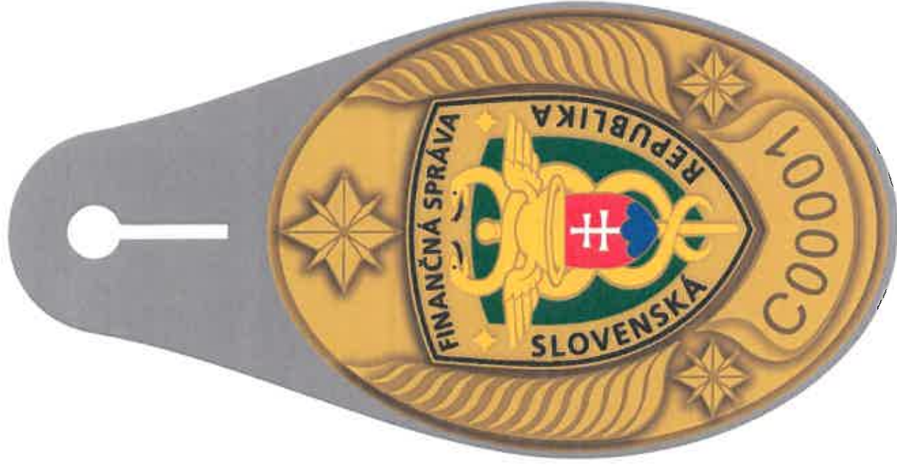
odznak - 50 x 70 mm