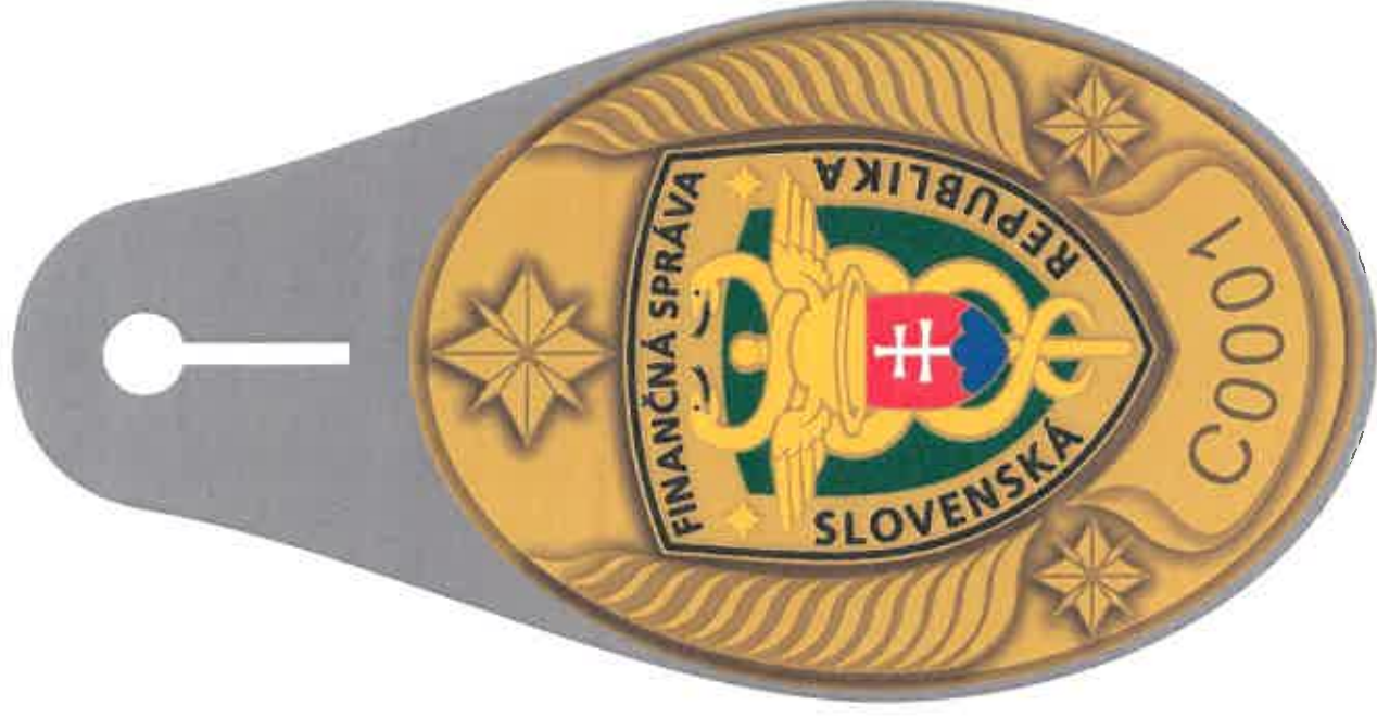
odznak - 50 x 70 mm