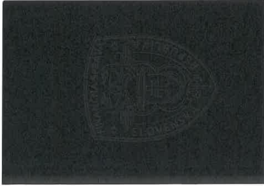
puzdro na preukaz, zatvorené - 86 x 123 mm