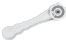
36 kHz Sterilný doťahovací kľúč