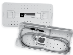
36 kHz Sterilizačný box