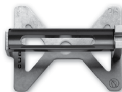
36 kHz Sterilný doťahovací držiak