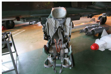
Raketový blok UB-32A/73