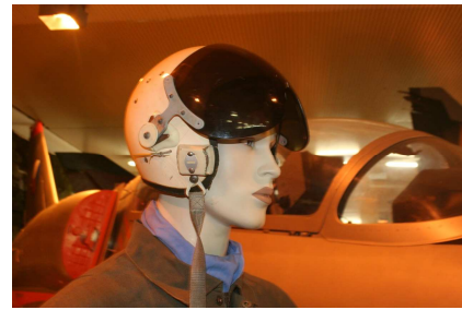
Prilba letecká ZŠ-5