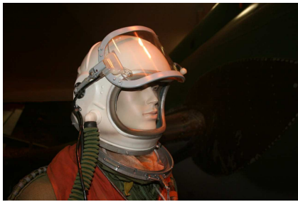
Prilba letecká GŠ-6M