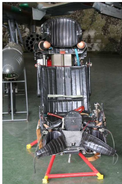
Raketový blok B-8M1