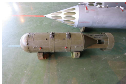
Letecká kazetová bomba RBK-250