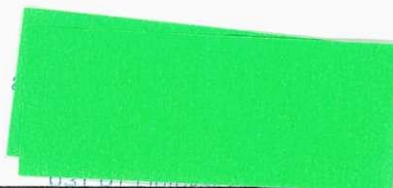
podpis zástupcu sociálneho zariadenia