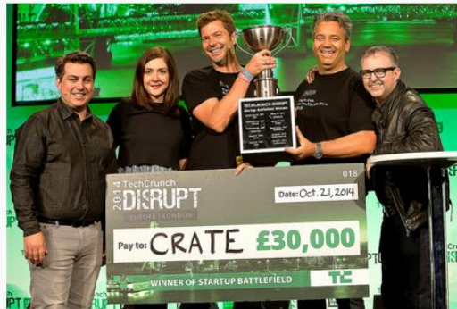
Startup Battlefield winner Crate celebrates onstage with the TechCrunch editors. London 2014.

Those include companies like Mint , Dropbox , Yammer , Tripit , Redbeacon , Qwiki , Getaround , and Solutio . The statistics on the 508 startups that have participated since the first competition, TC40 in 2007, tell a strong story: in aggregate, as of February 2015, they have raised $4.4 billion, while 65 have been acquired and two have gone public. TechCrunch makes the complete details of past Battlefields and participants available on the Battlefield leaderboard .