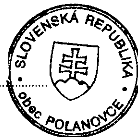
Jozef Kaľavský – starosta obce Obec Polanovce