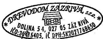
Ján Borončo konateľ