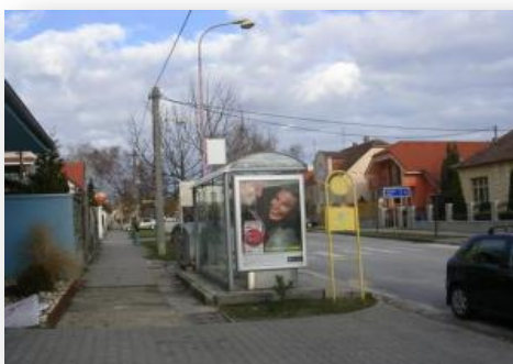
Citylight na autobusovej zastávke Masarykova, Michalovce