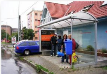
Citylight na autobusovej zastávke Bernolákova, Trnava