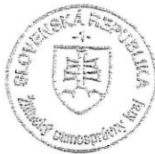
Ing. Juraj Blanár predseda