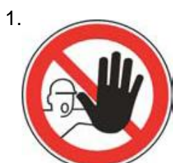
Nepovolaným vstup zakázaný (spolu so značkou č.2, 3 alebo 4 a príslušnou dodatkovou tabuľkou)